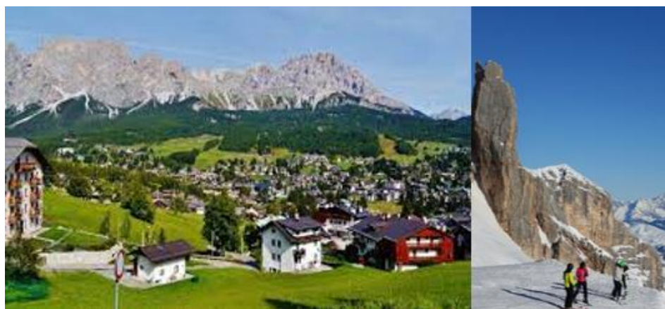
TAVOLA ROTONDA 2

Area oggetto attività formativa: 1_Architettura