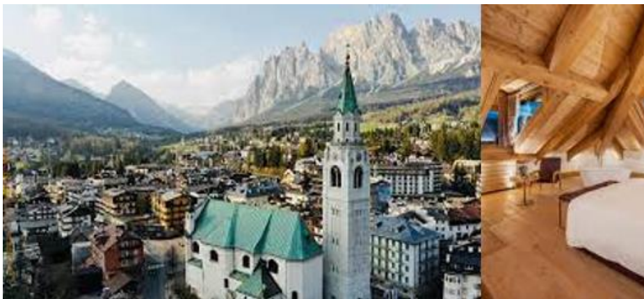
TAVOLA ROTONDA 1

Area oggetto attività formativa: 1_Architettura